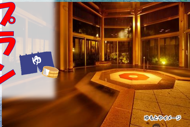
ゆもとやイメージ